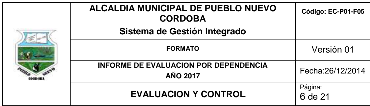
Cuadro No 1